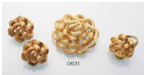
0631 Schmuck-Set - Brosche/Anhänger, Ohrringe und Ring - 750er GG, gestemp. Ges.-Gew.: 37 g. Brosche/Anhänger: D. 3,8 cm. Gew.: 15,6 g. Ohrringe: D. 2,1 cm. Gew.: 13,1 g. Ring: D. 2,1 cm. Ring-Gr. 49. Gew.: 8,3 g. (71499/0003)